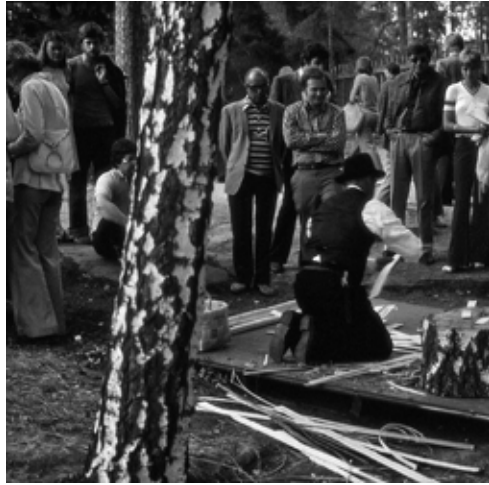
Kuva kongressin ulkoilmatapahtumasta, joka järjestettiin Seurasaarella.

sistä suomalaisista. Heillä oli edessä muutto toiseen majoituspaikkaan. Vaikka kongressi sujui hyvin, kriittisiä muistiinpanoja kertyi eri osa-alueilta tyyliin ”nähän me ei ainakaan tehdä”. Vähitellen kongressin aikana ja viimeistään keskusteluissa ”post-congress tourimme” aikana meille alkoi selvitä mikä ero on suurella rahalla ulkoistetulla kongressipalveluilla ja itsensä likoon laittavalla talkoohengellä aikaansaadulla kongressi-ilmeellä.