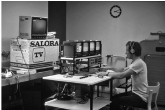
Kuvassa näkymä teknisestä huoltotilasta. Kongressin tekniikka kuten esimerkiksi luentosaleihin sijoitetut projektorit ja TV-kamerat edustivat ajankohdan parhaimmistoa.

Ohjelman sujuminen paikalla oli varmistettu huolellisesti. Medisiinareista oli koulutettu saleihin useita kymmeniä kongressiavustajia, jotka hyvin erottuvissa sinivalkoisissa kongressin logo-T-paidoissaan