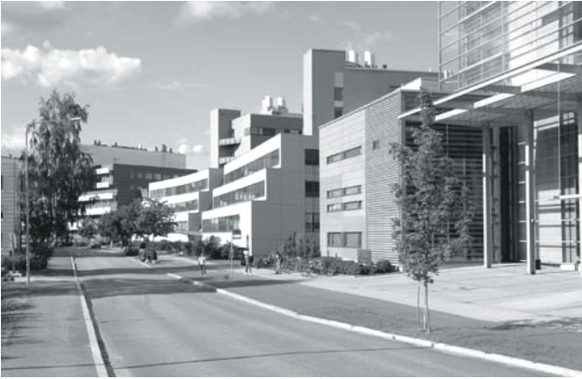
Biokeskus Helsingin yliopiston Viikin kampusalueella.

Eläinlääketieteen piiriin kuuluva lääkehoito on kauan ollut viranomaisten ohjaama sikäli, että ensimmäinen "Veterinär farmakopé för Finland" ilmestyi jo 1866. Se käsitti 221 lääkeainetta tai valmistetta sekä 20 voimakkaasti vaikuttavan lääkkeen sisäisesti annosteltavat enimmäisannokset täysikasvuiselle hevoselle, naudalle, lampaalle, sialle, koiralle ja kissalle. Toinen ajanmukaistettu painos ilmestyi 1886. Suomen eläinlääkärit koulutettiin II maailmansotaan saakka Saksassa ja sen jälkeen Skandinavian maissa. Kotimainen koulutus käynnistyi asteittain kun maahamme 1945 perustettiin Eläinlääketieteellinen korkeakoulu (EKK), jonka rakennukset valmistuivat vankityövoimalla Sörnäisten vankilan ja suurten teuras-tamoiden naapuruuteen 1960-luvulla. Ensimmäiseksi perustettujen prekliinisten oppiaineiden professuurien joukossa oli 1947 perustettu farmakologian ja toksikologian oppituoli. Sen jälkeen kliiniset professuurit perustettiin hitaasti varojen salliessa. Ensimmäiset kokonaan Suomessa koulutetut eläinlääkärit valmistuivatkin vasta 1968.